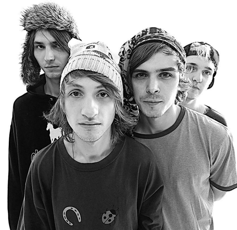
Ребята из группы «Нервы» знают, как достучаться до поклонников и мотивировать их к действиям.

Это просторечное словечко, ставшее отнюдь не достойной заменой выражению «в любом случае», почему-то прочно вошло в обиход в последние 10-15 лет. Оно отсутствует в нормативных источниках, но в то же время широко распространено как среди молодёжи, так и среди взрослых людей. Бывает даже, что оно нет-нет да и проскочит в речи дикторов на телевидении или общественных деятелей. И сразу становится неприятно,